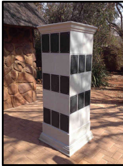
NG Pierre van Ryneveld